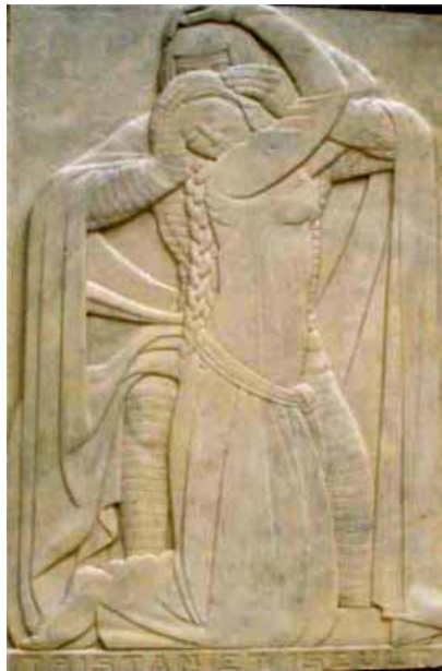
Extrait de la Pergola à Etampes

Pour les malades psychiques au long cours et leur famille, la loi du 11 février 2005 «pour l'égalité des droits et des chances, la participation et la citoyenneté des personnes handicapées» constitue une ouverture pour une meilleure reconnaissance de leurs droits et la promotion des moyens d'accès à plus d'autonomie. Encore faut-il appliquer cette loi. Compte tenu des échéances de mise en œuvre, c'est à marche forcée que les services des ministères, en lien avec les associations de familles et de handicapés, travaillent à l'élaboration des décrets d'application et à la mise en place des nouveaux organismes qui en découlent. Le plus voyant pour les usagers sera la «Maison départementale des personnes handicapées» qui abritera entre autres la «Commission des Droits et de l'Autonomie», remplaçant la COTOREP et la CDES. Mais il y a aussi la réforme de l'AAH et d'autres mesures qui vont quelque peu transformer le dispositif d'accompagnement des personnes en situation de handicap. Beaucoup d'entre nous